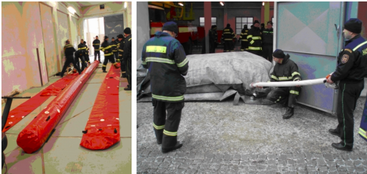
Obrázek 1: Mobilní protipovodňové bariéry

Dalším možným řešením je nákup tzv. mobilních protipovodňových bariér . Na trhu existuje celá řada výrobců těchto systémů, např. GUMOTEX, EKO-SYSTÉM, ZAHAS, PBS Rotava, RUBENA. Mezi jejich základní výhody patří snadná manipulace a skladování , nevýhodou je ovšem jejich finanční náročnost .